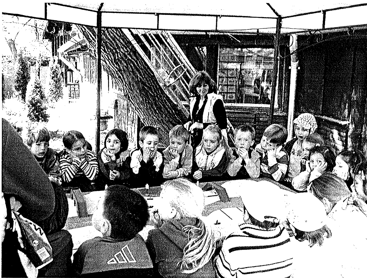
VADKACSA KenuOVi előkészítő bemutató – 2011.

Az Egyesület júniusban folytatta a VADKACSA KenuOvi programot, melynek keretében négy programnap került megszervezésre, melyen Dunakanyar 8 óvodája vett részt: összességében 240 óvodás gyermek és szüleik számára biztosítottuk a „Dunával való találkozás” első lehetőségét.